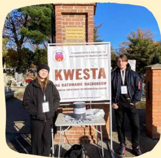
Kwesta na Ratowanie Nagrobków Starego Cmentarza rzymsko-katolickiego w Piotrkowie