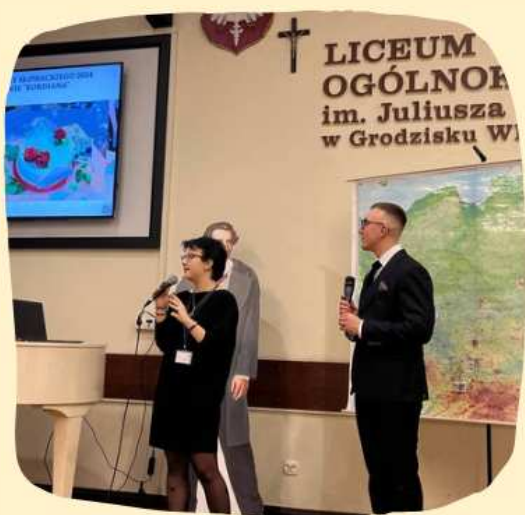
XXXVII Zlot Europejskiej Rodziny Szkół im. Juliusza Słowackiego