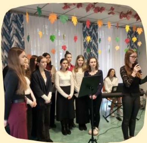
Koncert w Domu Pomocy Społecznej

W naszej szkole kształtujemy postawy obywatelskie i prospołeczne, dzięki inicjatywom podejmowanym przez Samorząd Uczniowski, Wolontariat, SK PCK, SK Caritas