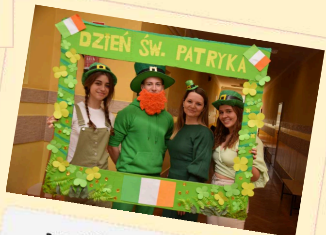
DZIEŃ ŚWIĘTEGO PATRYKA 2023