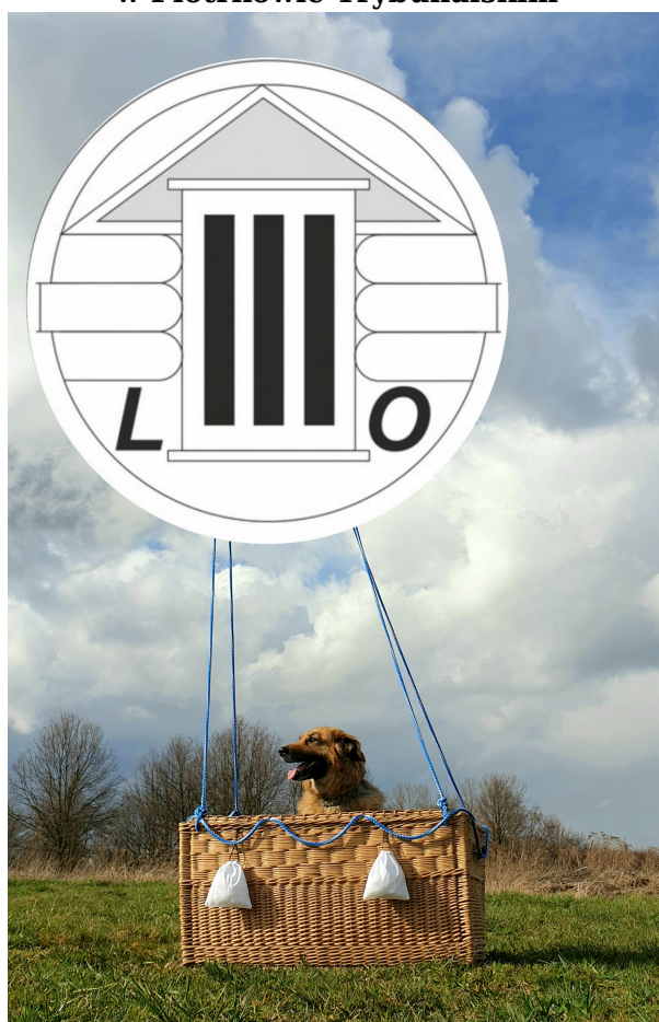
3 miejsce - Filip Rol - uczeń Szkoły Podstawowej nr 12 im. Kornela Makuszyńskiego w Piotrkowie Trybunalskim